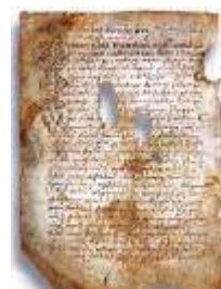
Псковская судная грамота

Двинская уставная грамота 1397 года. Мздоимство упоминается в русских летописях XIV века, например в Двинской уставной грамоте 1397 года в статье 6: «А самосуда четыре рубли, а самосуд то: кто изыснав татя с поличным, да отпустит, а себе посул возьмет, а наместники доведаются по заповеди, ино то самосуд, а опричь того самосуда нет». Там же, в статье 8: «...а черес поруку не ковати, а посула в железех не просити; а что в железех посул, то не в посул».