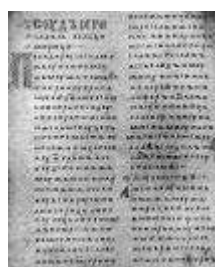
Двинская уставная грамота

Лихоимец – жадный вымогатель, взяточник».